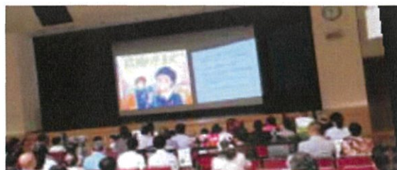
△春休みヒューマンシアター