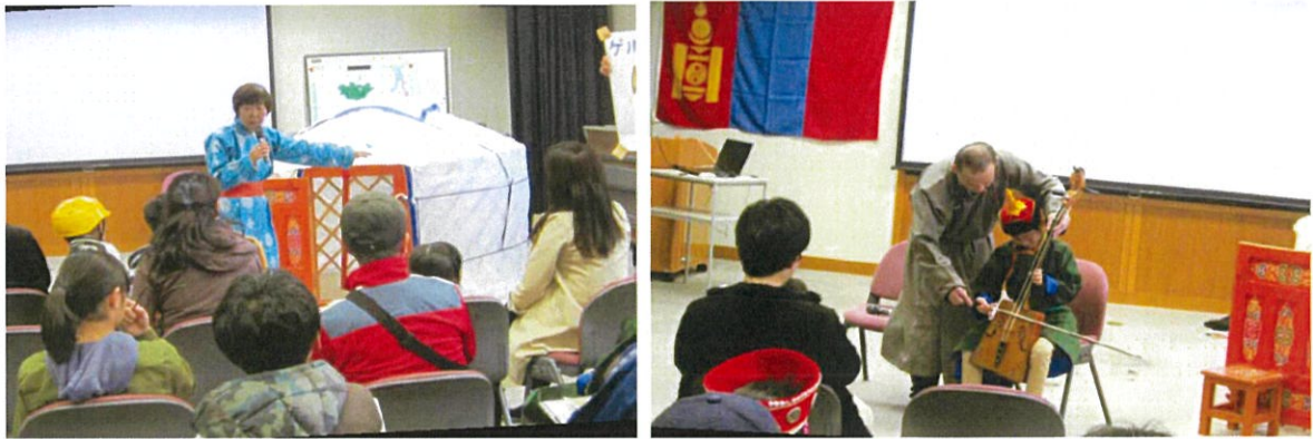
△昨年の西区人権フェスタ（モンゴルの文化とあそび）

西区人権フェスタ、PTA 人権研修会、人権展、人権週間における啓発活動など、区の人権事業や啓発活動に参画するとともに、地域に根差した啓発活動を自ら企画・実施されています。